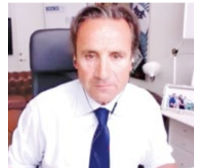
Роберто Монтелла, генеральный секретарь ПА ОБСЕ

Схожей точки зрения придерживается и бывший президент Сената швейцарского парламента, в прошлом член бюро ПА ОБСЕ Филиппо Ломбарди. В качестве вице-президента Группы Шёлкового Пути швейцарский политик принимал активное участие в формировании Группы с начала её создания.