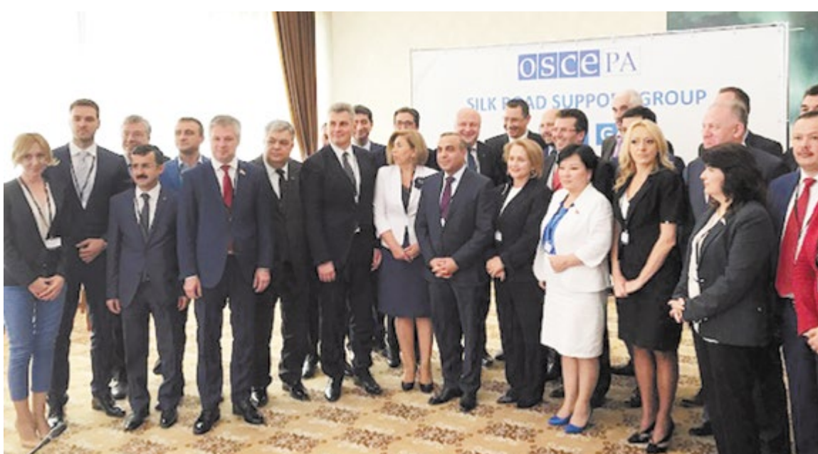
День основания Группы поддержки Шёлкового Пути ПА ОБСЕ

Tedros Abhanom обратил также внимание на важную перспективу и потенциал концепции Шёлкового Пути Здоровья в обеспечении партнерства в борьбе с вирусом, улучшении инфраструктуры и доступа к медицинским услугам, таким как диагностика и лечение.