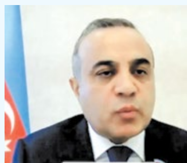
Azay Guliyev, President of the SRG PA OSCE

The themes of East-West relations and building a new dialogue in post-Covid 19 situation were the focus of a series of high-level video conferences that took place this summer in various representative formats. Two of them directly touched upon the relationship between Europe and China, as well as the New Silk Road (Belt and Road Initiative).