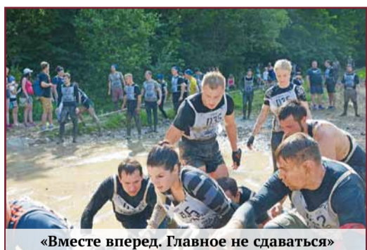
«Вместе вперед. Главное не сдаваться»