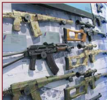
Выставочный стенд ТОЗа

В соответствии с комплексным Планом научно-технического развития ПАО «ТОЗ» и выпущенными приказами генерального директора на предприятии продолжается технологическая подготовка по постановке на производство узлов и деталей изделия 9М133-1. Полную технологическую подготовку планируется закончить в III квартале этого года. В течение IV квартала планируется завершить инструментальное оснащение, изготовить первые комплекты деталей и сборочных единиц «отсека рулевого привода», «контейнера», «электронной задержки» и «плиты задержки», провести их квалификационные испытания и перейти на серийное изготовление сборочных единиц в полном объеме.