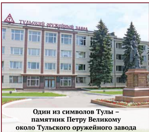
Один из символов Тулы – памятник Петру Великому около Тульского оружейного завода

В июне этого года состоялось годовое общее собрание акционеров ПАО «Тульский оружейный завод». В собрании лично, через своих представителей и заочно приняли участие акционеры из города Тулы, из Тульской области и из других регионов России.