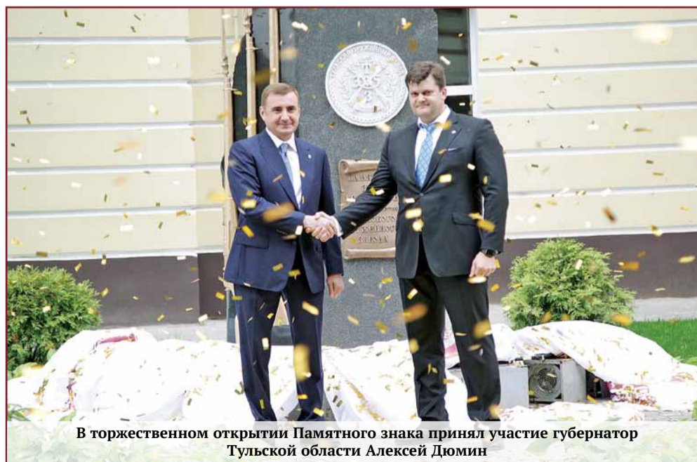
В торжественном открытии Памятного знака принял участие губернатор Тульской области Алексей Дюмин

В богатой на события биографии предприятия — множество славных страниц. Не случайно для празднования был выбран июнь, ведь некоторые знаковые для коллектива завода события произошли именно в этом месяце.