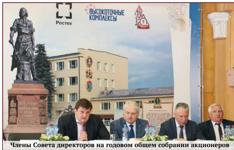
Члены Совета директоров на годовом общем собрании акционеров

Основными потребителями стрелкового вооружения ПАО «ТОЗ» являются силовые структуры РФ. В минув-