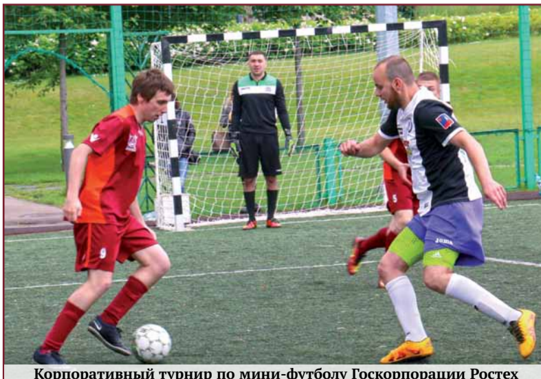
Корпоративный турнир по мини-футболу Госкорпорации Ростех