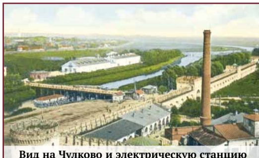
Вид на Чулково и электрическую станцию

Осуществляется проект в сотрудничестве с ПАО «ТОЗ». На двадцати одном гектаре, предназначенном для разбивки уникальной набережной, будут гармонично сочетаться прогулочные, музейные, игровые, спортивные зоны,