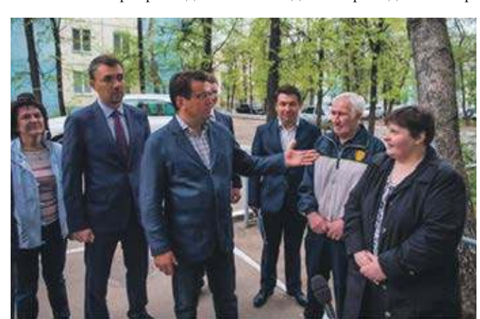
Руководство города, представители городского Исполкома регулярно встречаются с жителями в ходе проведения капитального ремонта. Кроме того, обратная связь осуществляется с помощью системы «Открытая Казань»

В Казани существует институт Советов МКД, в рамках ст.161.1 Жилищного кодекса Российской Федерации. Советы многоквартирных домов