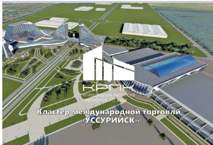
Кластер международной торговли «УССУРИЙСК»

Этот проект по праву считается одним из ключевых для всего Приморского края, так как он направлен на укрепление торгово-экономического сотрудничества, прежде всего с Китаем. Создание кластера международной торговли в Уссурийске станет важным шагом для роста товарооборота между Россией и Китаем. По нашим расчетам, реализация проекта позволит увеличить объем услуг транспортно-логистического сектора в 3 раза, а туристического сектора – в 2 раза, причем этот эффект будет ощущаться не только в Уссурийском городском округе, но и во всем Приморском крае.