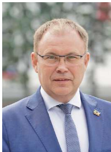
Илья Середук, губернатор Кузбасса

Кузбасс – это не только угольный и металлургический центр России, но и территория возможностей и перспектив роста. Наш ре-