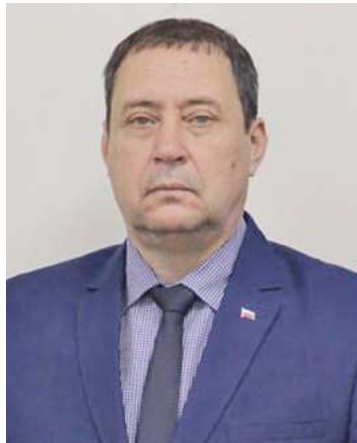
Константин Зинченко, глава Волновихского муниципального округа ДНР