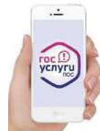
Платформа обратной связи

На площадке Президентской академии состоялась комиссия Госсовета по направлению «Инвестиции». Участники обсудили новые механизмы поддержки инвестиций и улучшения делового климата.