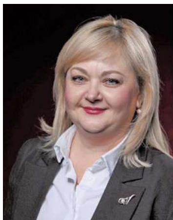
Светлана Гребенкова, глава города Алчевска ЛНР