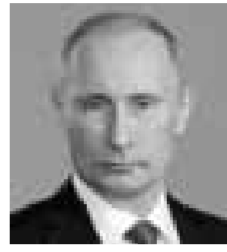
Владимир Путин, Президент Российской Федерации