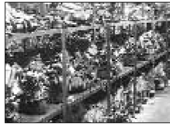
Специалисты советуют, как не стать жертвой патентных мошенников