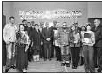
Российские ведомства ценят содействие отечественных журналистов