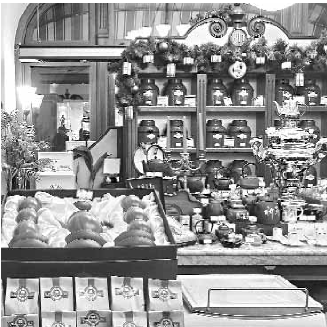
Новый закон в отечественной торговле разложил все «по полочкам»

осуществляющих торговлю, и объединений хозяйствующих субъектов, осуществляющих поставки товаров, в формируемой и реализуемой государственной политике в области торговли. Законодательно установлен ряд антимонопольных мер, направленных на прекращение недобросовестной практики в сфере торговли продовольственными товарами. Хозяйствующим субъектам, осуществляющим торговую деятельность, а также требовать предоставления хозяй-