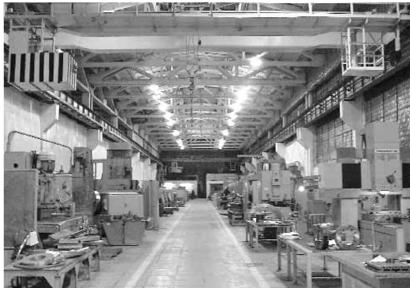
В цехах отечественных предприятий ожидается оживление

Мы прогнозируем, что ЦБ РФ продолжит поддерживать российскую экономику, по крайней мере, в первом полугодии 2010 года. В течение года мы ожидаем снижения ставки рефинансирования до