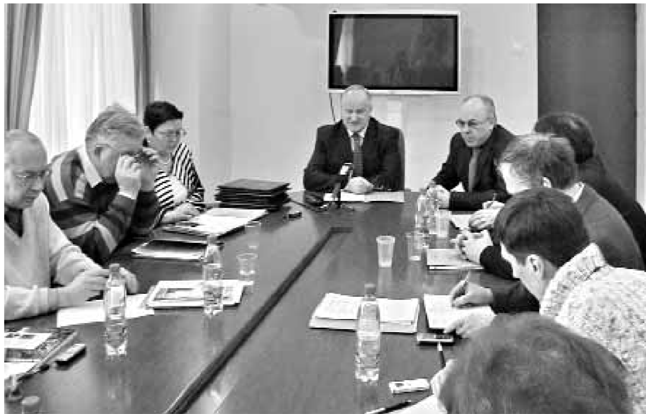
Общественный совет при Росприроднадзоре. В каждом Федеральном округе Общественные советы при департаментах Росприроднадзора будут активно участвовать в популяризации конкурса и отборе лучших публикаций на конкурсе. То есть, конкурс будет реально носить общероссийский характер.

Большую работу по подготовке и проведению конкурса взял на себя