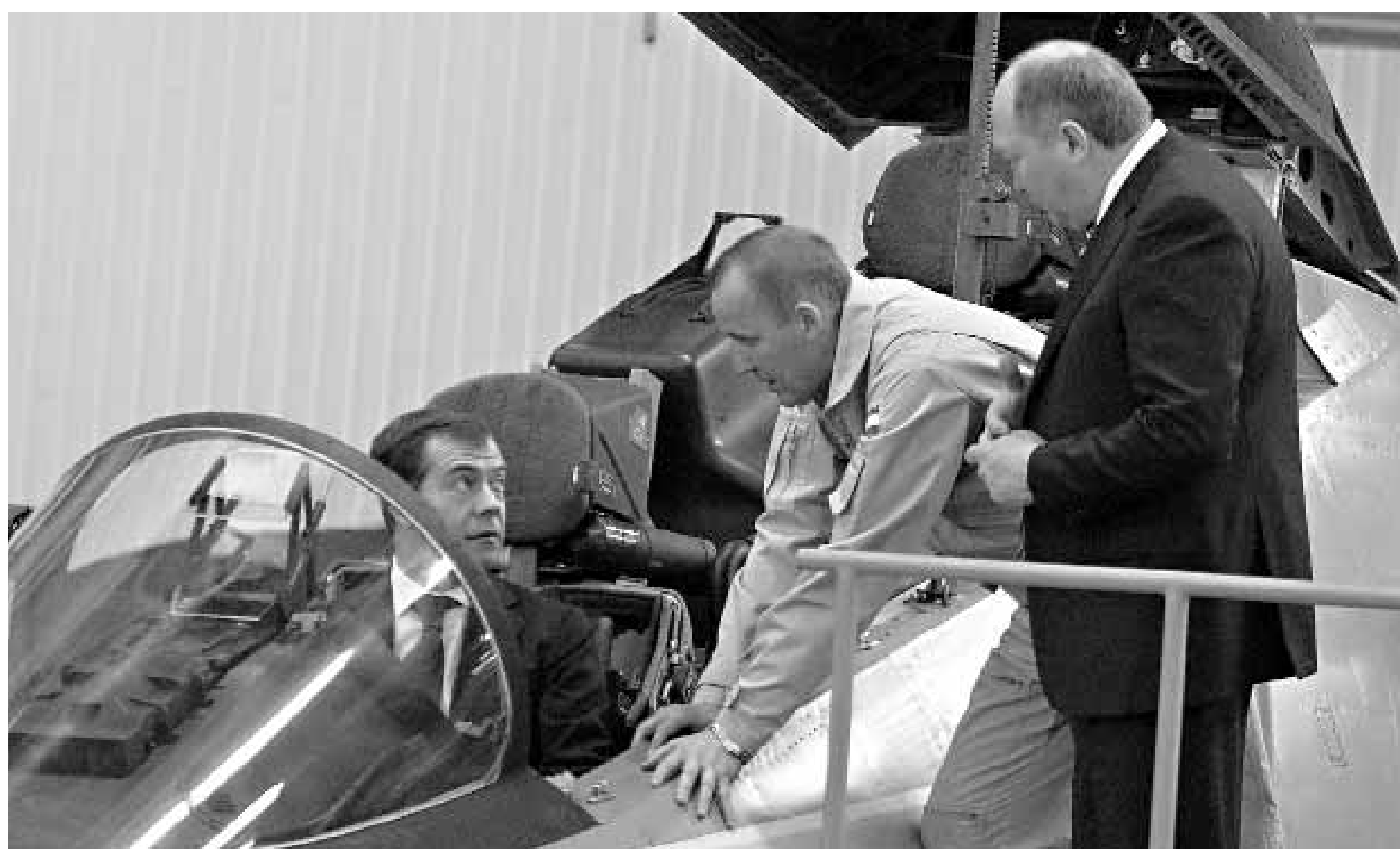
Дмитрий Медведев непосредственно погрузился в проблемы и достижения Оборонно-промышленного комплекса страны

Антикризисная помощь не всегда доходит вовремя