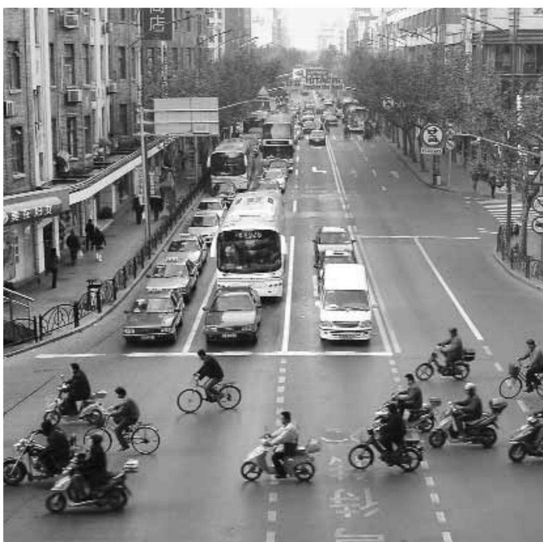
Китайское направление — одно из самых привлекательных для российского экспорта

В 2010 году «Газпром», как сообщал замглавы холдинга Александр Медведев, по консервативному прогнозу будет продавать газ в Европу в среднем по $300 за тысячу кубометров. Начало поставок российского газа в Китай возможно в 2014-2015 годах, заявил во вторник вице-премьер РФ Игорь Сечин, курирующий в правительстве ТЭК. По его словам, в начале 2010 года стороны проводят переговоры по параметрам поставок, включая цену, и