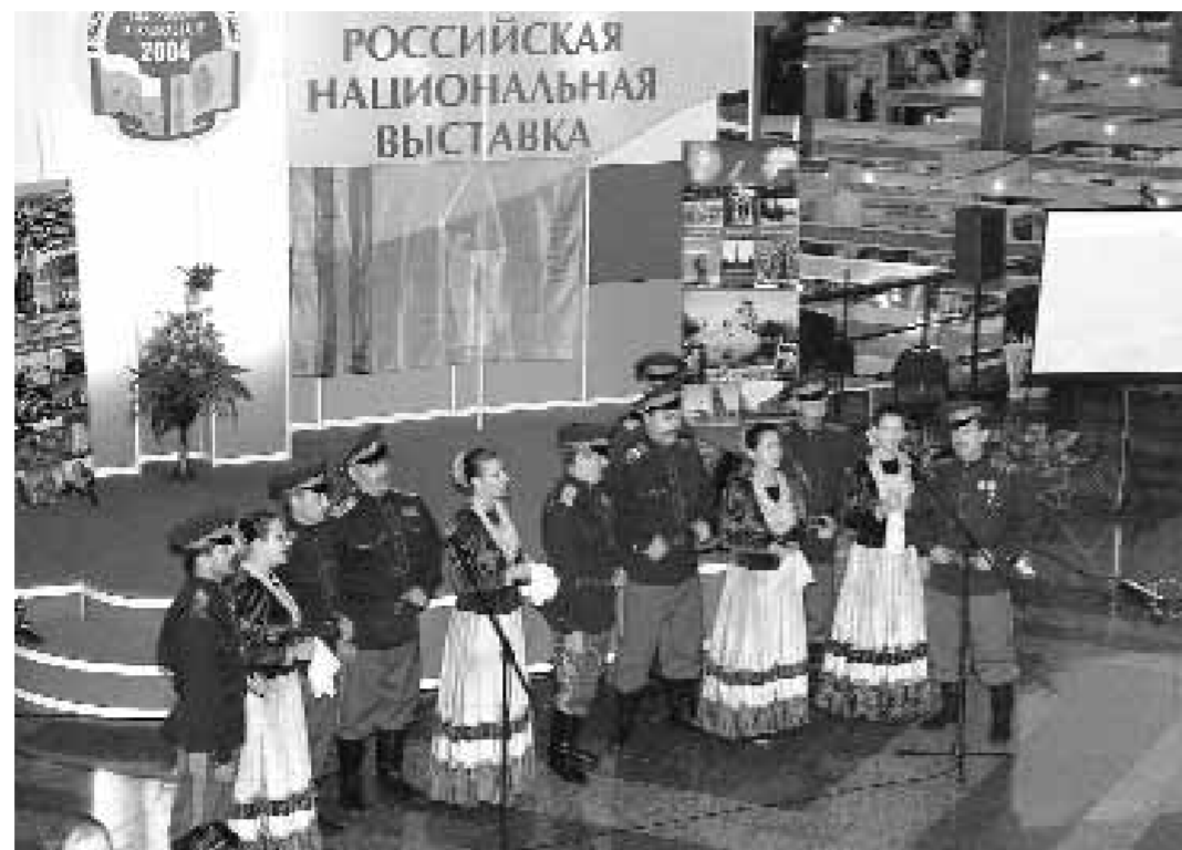
Россия умеет достойно представить свои потенциалы

Выставка разместится на площади свыше 3500 кв. м. и будет включать три раздела: «Россия-Казахстан. Приоритетные проекты межгосударственного сотрудничества», «Инновационная интеграция» и «Экспортный потенциал России».