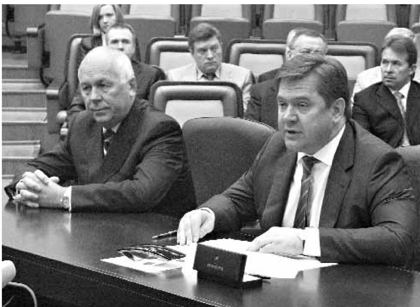
Сергей Чemezов и Сергей Шматко знают, в каком направлении развивать содружество промышленности и энергетики

— в разработке и внедрении ГК «Ростехнологии» совместно с ОАО «РусГидро» и ОАО «ИНТЕР РАО ЕЭС» энергоэффективных, энергосберегающих и экологически чистых технологий, создание условий для их широкого применения при создании, реконструкции и эксплуатации объектов на основе