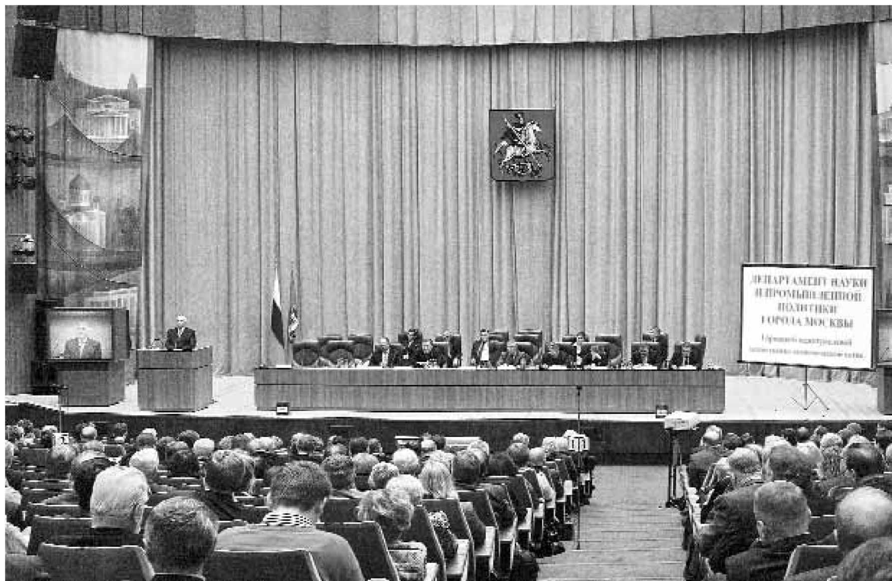
Хозяйственно-экономический актив собирает ведущих представителей московской промышленности и науки

Параллельно РОСНАНО в 2009 году намерено приступить к решению задачи по стимулированию экспорта продукции российской наноиндустрии.