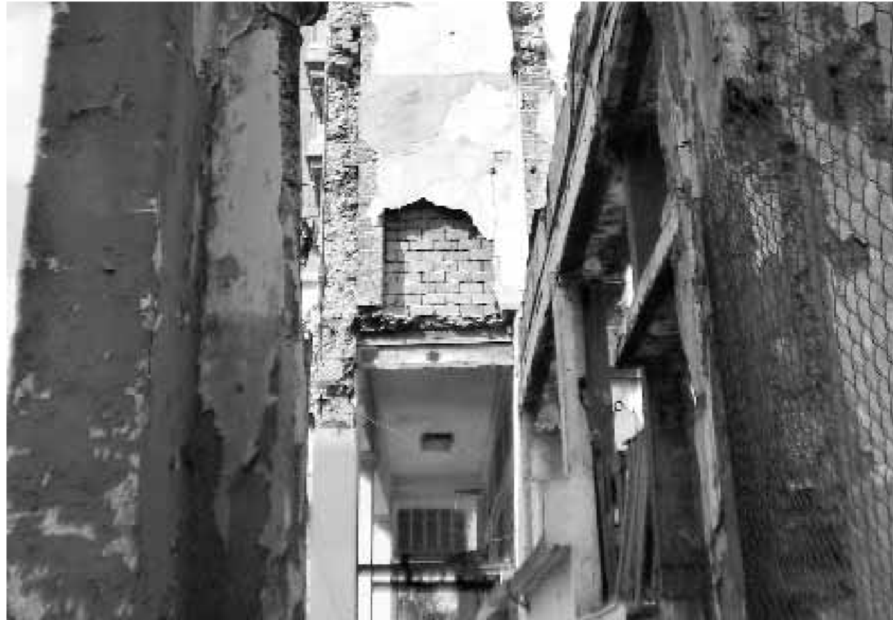
Финансовые кризисы уже разрушили немало процветавших на Земле цивилизаций