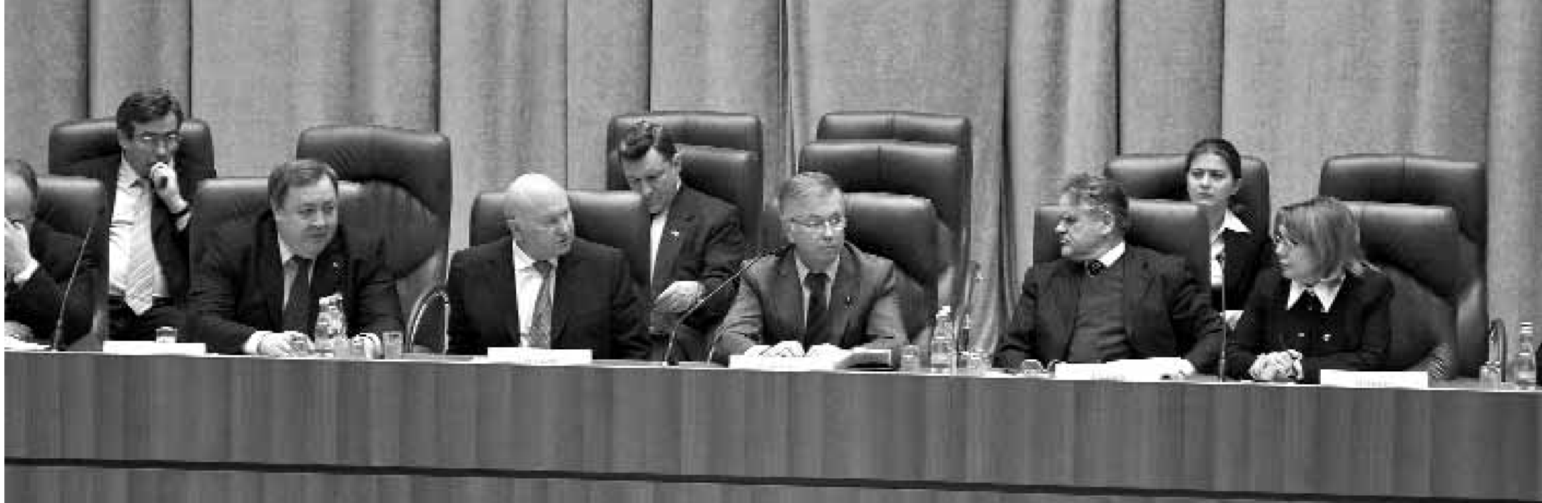
В этом году экономические дискуссии носят исключительно судьбоносный характер

В тех опросах и анкетах, о которых я раньше говорил, 75% предприятий связывают свое развитие с техническим перевооружением, с инновациями, с НИОКРами, и это очень приятно. Половина предприятий выбирается внедрить у себя международную систему стандартов. Примерно 40% предприятий собираются продолжить работу по созданию своих собственных центров по обучению и подготовке кадров. Все это в какой-то степени вселяет уверенность, что их планы направлены на развитие. Если мы эти планы правильно скоординируем и хорошо выстроим программу их реализации, мы с вами достигнем вместе успехов».