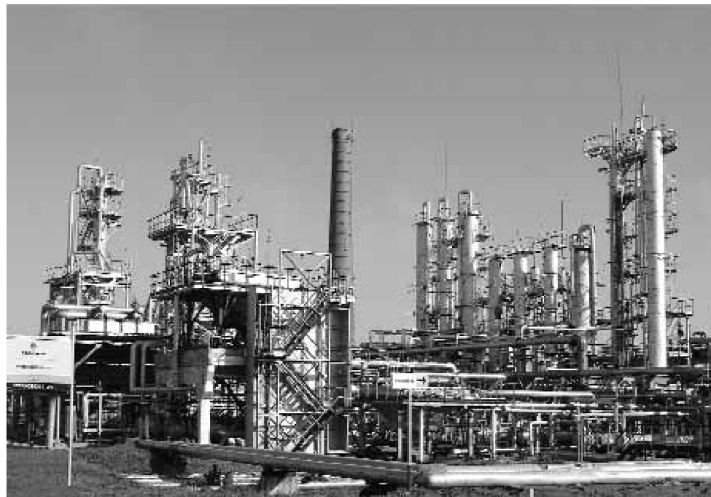
Падение стоимости нефти негативно отразилось на рынке продукции оргсинтеза

Мировые цены на метанол, основной продукт Метафракса, также подверглись серьезной коррекции. Данный факт негативно отразился на финансовых результатах компании. Тем не менее, компания обладает запасом ликвидности в $130 млн, что, по нашему мнению, может успешно справиться с кризисом. Кроме того, Сибметакхим, совместное предприятие Сибур Холдинга и Востокгазпрома, продадо принадлежавшие ему 33,4% акций Метафракса. Сибур Холдинг принял решение о выходе компании из метанолевого бизнеса в связи с необходимостью сосредоточить усилия на поддержке и развитии профильных направлений деятельности. Мы считаем, что данное событие носит позитивный характер, поскольку выход Сибура из состава акционеров Метафракса увеличит инвес-