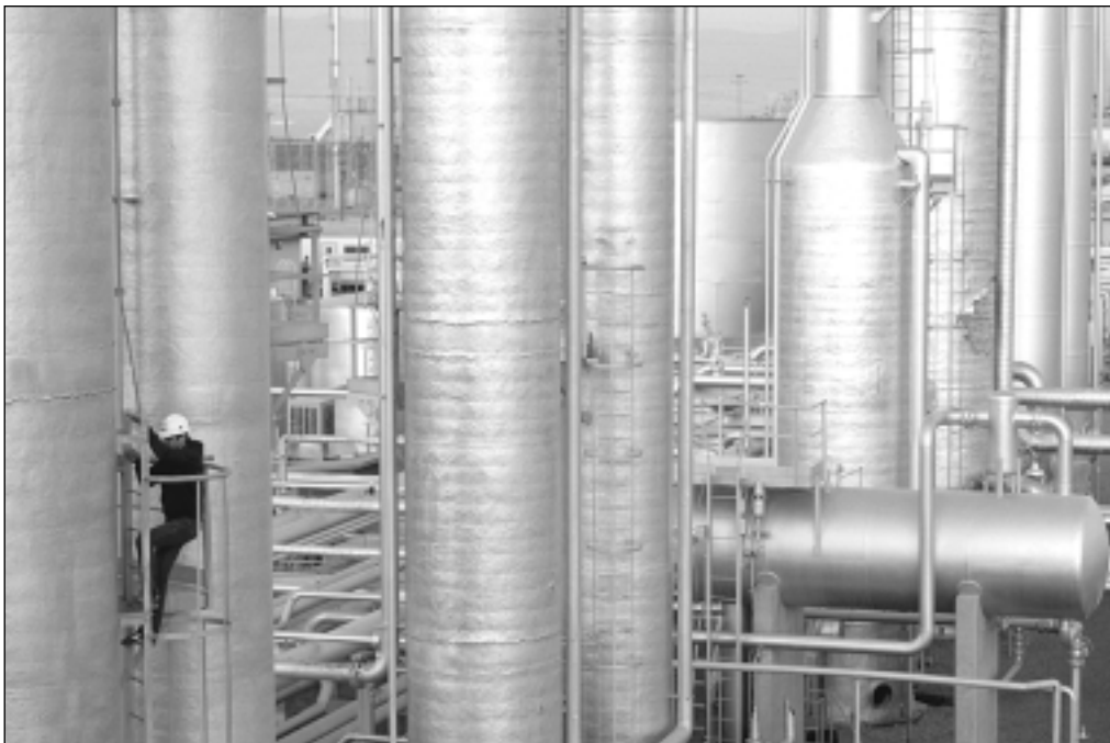
В газопереработке сложно отличить истинное банкротство от фиктивного

Федеральная служба России по финансовому оздоровлению и банкротству (ФСФО) направила в правоохранительные органы заключение о признаках преднамеренного банкротства Тобольского нефтехимического комбината (ТНХК), которое было совершено компанией СИБУР.