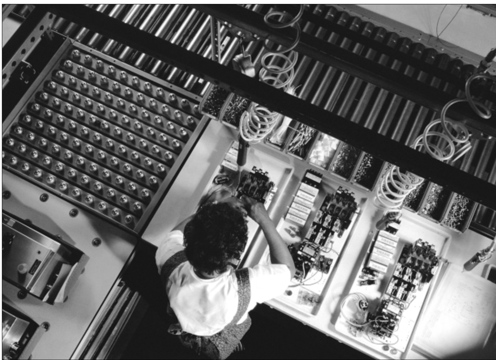
Российская промышленность готовится перейти к торговле знаниями и технологиями