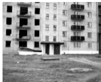
Реформа российского ЖКХ должна увеличить эффективность отрасли