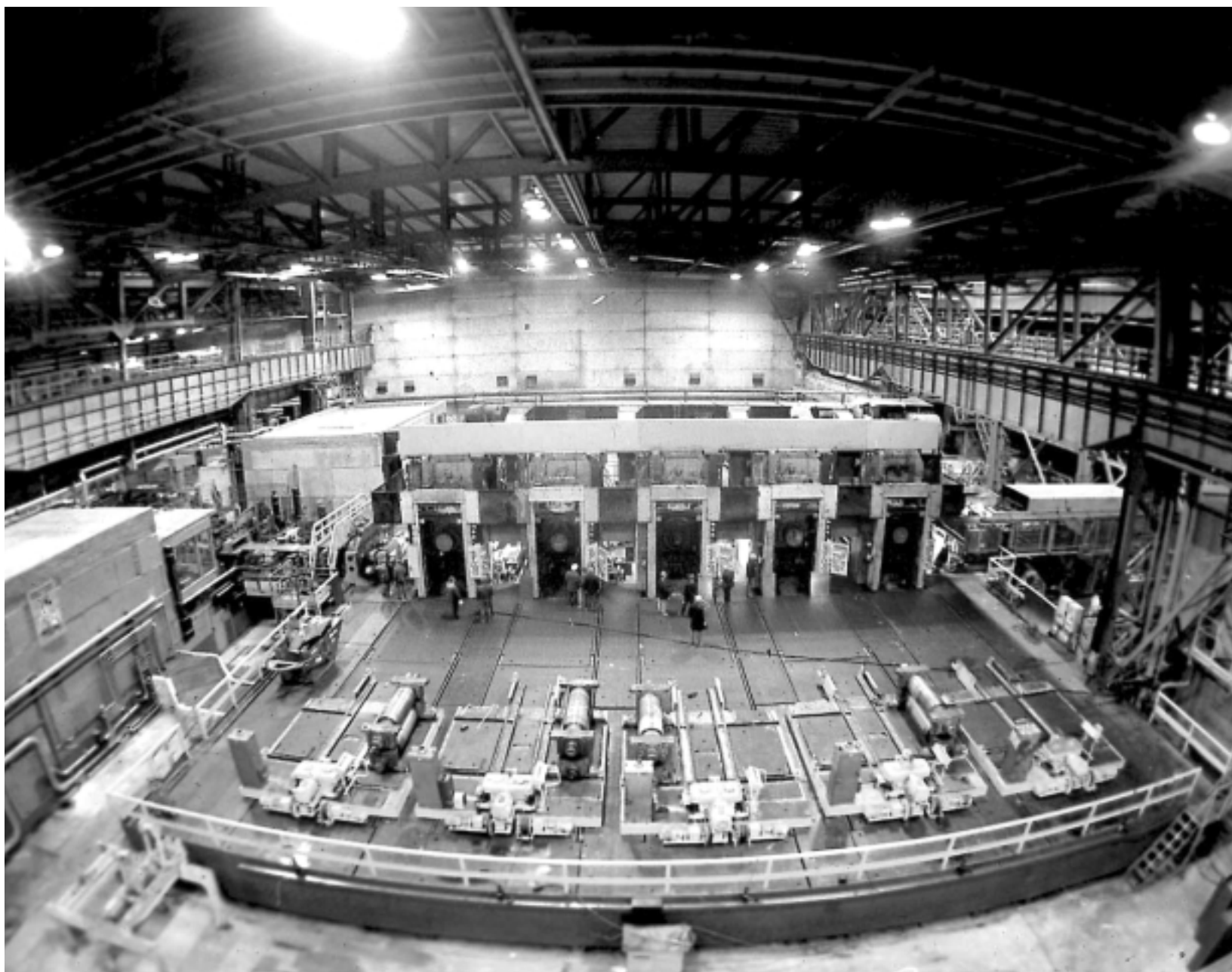
Инвестиционному процессу нужны системные стимулы

И удивляться такого рода постоянству не приходится — достаточно лишь указать на то обстоятельство, что займы свыше $100 млн предоставляют лишь шесть отечественных банков, в то время как суммы, необходимые для реализации мало-мальски значимых в макроэкономическом масштабе проектов, существенно превышают названную цифру.