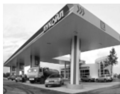
В России продолжают местные конфликты из-за цен на бензин