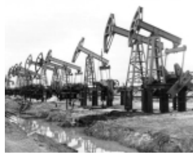
Россия и ОПЕК ищут новый справедливый коридор цен на нефть