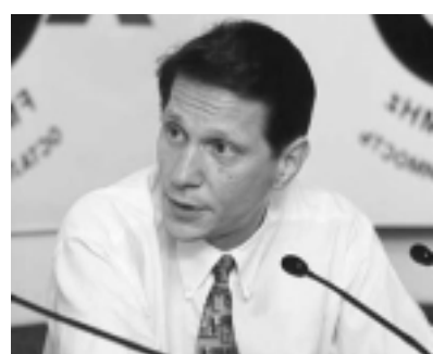
Комиссия Александра Жукова ищет индикаторы качества работы ведомств