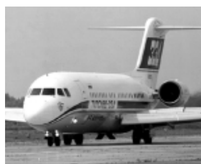
Корпорация «МиГ» возобновила работу над Ту-334-100